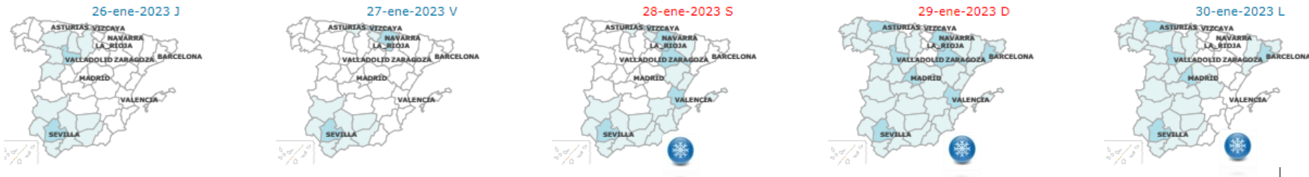
Referencia convencional demanda total